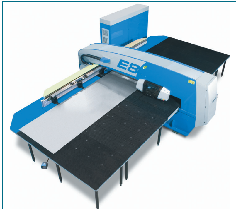
En el punzonado de chapas grandes y pesadas, de hasta 1.500x4.200 mm, la E8 proporciona un elevado rendimiento

En la actualidad, tras años de experiencia, existen centenares de clientes en todo el mundo satisfechos con el resultado de las ecológicas (E) de Finn-Power.