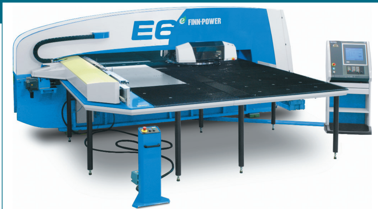
La punzonadora ecológica E6 trabaja con chapas de hasta 1.500x3.000 mm

Pero, ¿cuáles son las características que diferencian las ecológicas de Finn-Power del resto de equipos del mercado?