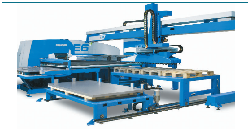
El sistema de carga y descarga LST recoge las piezas de la mesa de la E6 y aparta los esqueletos desde el mismo lado