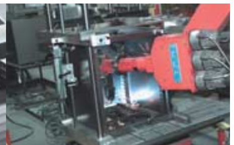
Hier der 6-Achsen Reis-Roboter mit MIG/MAG Push-Pull-Schweißanlage und zwei Schweißstationen.