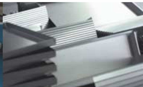
Die paneelartige Teile sind dann das Metier des Biegezenters von FinnPower.