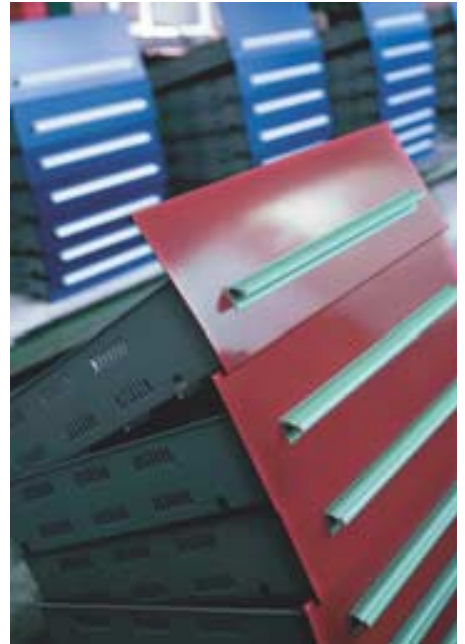
Die Ausbrüche und Prägungen nahe Biegelinie stellen hohe Ansprüche an Biegezentrum von FinnPower.

Vor allem verweist er in dem Zusammenhang auf die tolle Unterstützung von FinnPower in punkto Sonderwerkzeuge: „Gerade bei der Fertigung von Schubla-