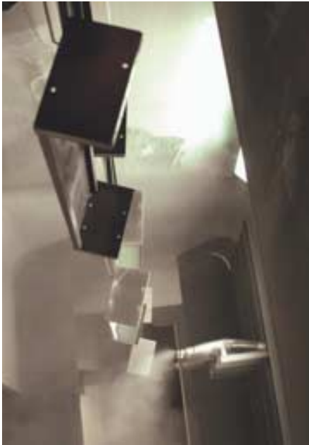
Der Blechbearbeitung und Schweißtechnik nachgeschaltet folgt die individuelle Farbgebung via Pulverbeschichten.

Power mit ihrer integrierten Winkelschere und dem ausgereiften Be- und Entladesystem ohne Zweifel die beste Alternative im Markt.“